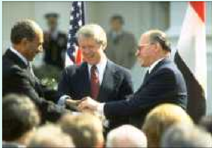
Friðarsamningar Ísraels og Egypta