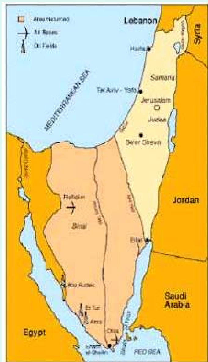
Israel lét Sinaiskaga af hendi eftir friðarsamningana við Egypta

Ísrael er tilbúið til að leggja mikið í sölurnar fyrir raunverulegan frið.