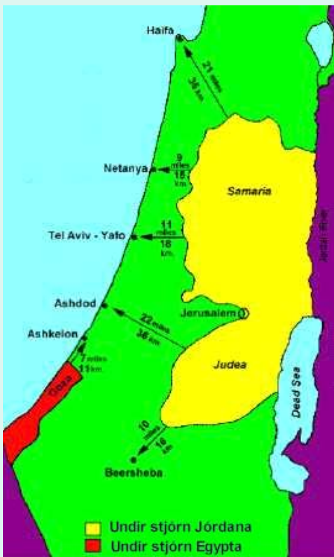
Vegalengdir frá þéttbýlisstöðum í Ísrael að vopnahléslinum fyrir 1967