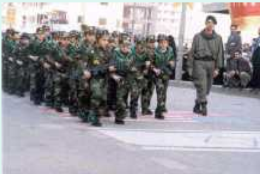
Palestínsk börn ganga á bandarískum og ísraelskum fánum í herþjálfunarbúðum.