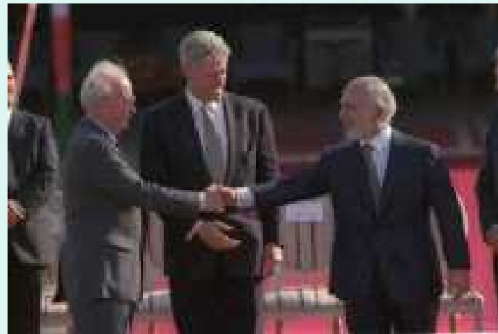
Friðarsamningar Ísraels og Jórdaníu